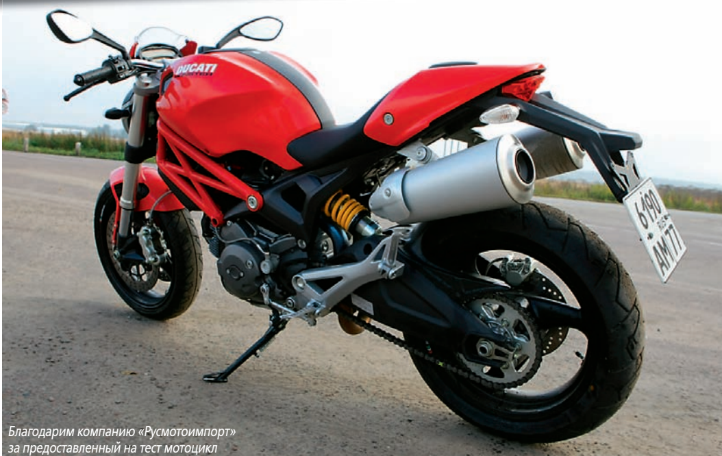
Благодарим компанию «Русмотоимпорт» за предоставленный на тест мотоцикл

Продукт под уважаемым брендом, техническая продвинутость, демократичный ценник – три кита, на которых держатся на рынке среднекубатурные модели Ducati Monster